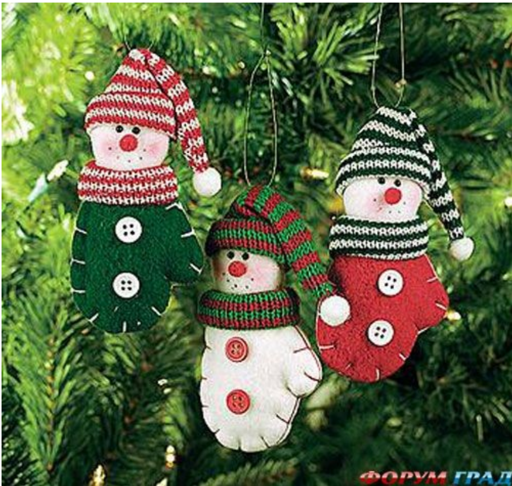
ФОРУМ ГРАД Снеговички