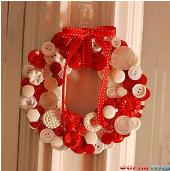
ФОРУМ ГРАД Венок