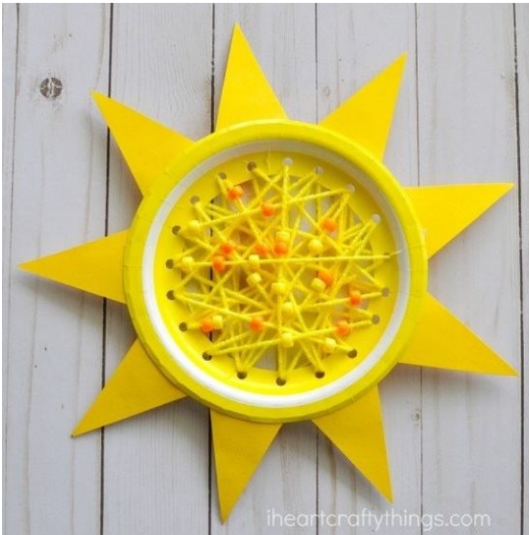
Солнышко или звезда